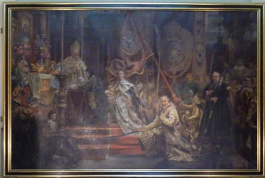
ŚLUBY KRÓLA JANA KAZIMIERZA Lwów, 01. 04. 1656 r.